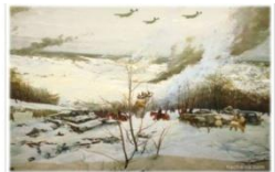
26 августа дивизию включили в состав 52-й армии. В октябре она прибыла в Москву и получила направление в Волоколамск. Шел пятый месяц войны. Фашистские полчища рвались к столице с запада. Москву защищала 16-я армия Рокоссовского, в которую теперь вошла 316-я дивизия. Здесь, начиная с 14 октября, шли ожесточенные бои.

В боях под Москвой особое упорство, мужество и героизм проявили воины легендарной 316-й стрелковой дивизии. Она была сформирована в Казахстане. Приказом военного Совета Среднеазиатского военного округа командиром дивизии был назначен генерал-майор Иван Васильевич Панфилов.