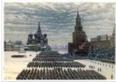
7 ноября 1941 г. на Красной площади состоялся военный парад. Его участники прямо с парада ушли на фронт.