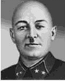
Иван Васильевич Панфилов

родился 1 января 1893 года в городе Петровске (ныне Саратовской области) в семье мелкого конторского служащего. С 11 лет начал трудовую жизнь. В 1915 году был призван в армию и после окончания учебной команды в чине унтер-офицера направлен в 638-й Ольпинский пехотный полк. В октябре 1918 года добровольцем вступил в 1-й Саратовский полк, который вошел в 25-ю стрелковую дивизию под командованием В. И. Чапаева.