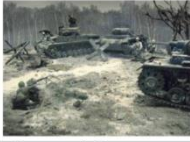
Великая Отечественная война была тяжелым испытанием для советских людей. Взяв заветную большую территорию Советского Союза, фашисты рвались к сердцу нашей Родины - Москве.