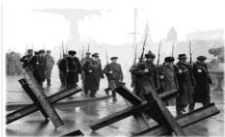
К Москве в суровые годы Великой Отечественной войны были прикованы взоры миллионов советских людей. Москва была для них олицетворением героизма, стойкости и мужества. Вся страна никогда не забудет тех дней. В бронзе, граните и мраморе обелисков, мемориальных досок, стел, в названиях улиц увековечена память славных воинов.