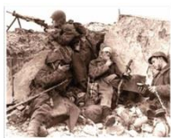
16 ноября 1941 года, 148-й день войны. Воскресенье. И хотя на войне выходных не бывает, даже этот факт воспринимается по-особому.

16 ноября 1941 года. 148-й день войны. Воскресенье. И хотя на войне выходных не бывает, даже этот факт воспринимается по-особому.