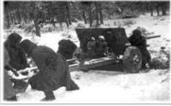
В боях под Москвой особое упорство, мужество и героизм проявили воины легендарной 316-й стрелковой дивизии. Она была сформирована в Казахстане. Приказом военного Совета Среднеазиатского военного округа командиром дивизии был назначен генерал-майор Иван Васильевич Панфилов.