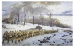
В дивизии было скомплектовано три стрелковых полка, один артиллерийский и спецподразделение. По национальному составу дивизия являлась воплощением дружбы и братства народов Советского Союза. Всего в дивизии насчитывалось более 30 национальностей.