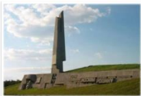
Памятник-монумент защитникам Москвы был открыт 24 июня 1974 года и расположен на 40-м километре Ленинградского шоссе у въезда в Зеленоград, город вблизи ст. Крюково, где в годы войны проходили ожесточенные бои и где были окончательно остановлены германские дивизии.