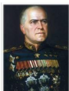
Оборону Москвы возглавил генерал Георгий Константинович Жуков.